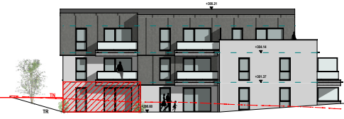
A ELEVATION SUD-OUEST ech. 1/500