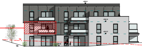
A ELEVATION SUD-OUEST ech. 1/500