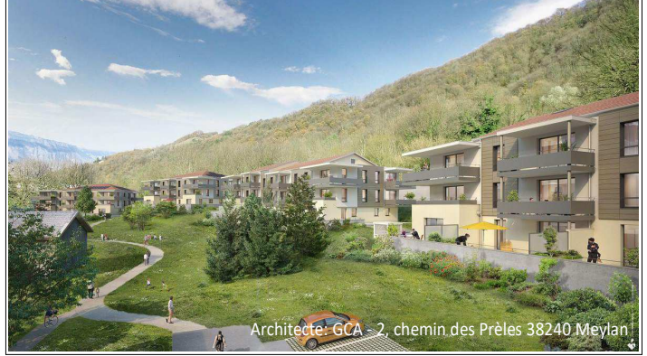
Architecte: GCA - 2, chemin des Prêles 38240 Meylan