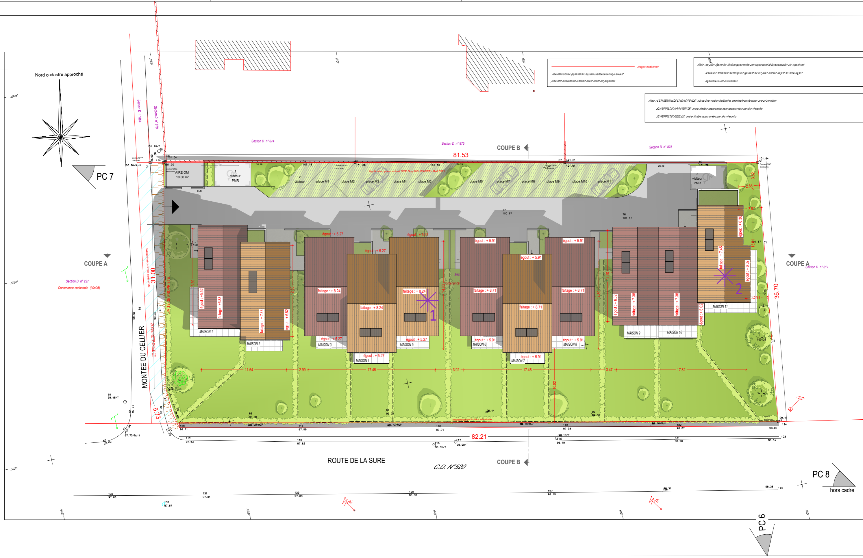
Image cadastrale Résultat d'une application de plan cadastral et ne pouvant pas être considérée comme étant limite de propriété

Note : ce plan figure les limites apparentes correspondant à la possession de l'occupant Seuls les éléments numériques figurant sur ce plan ont fait l'objet de mesures régulières de conversion.