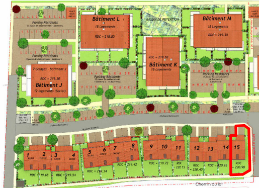
Plan du R+1